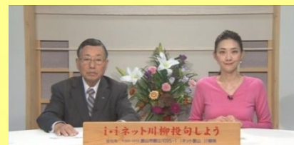
選者:石田一郎 司会:真紀