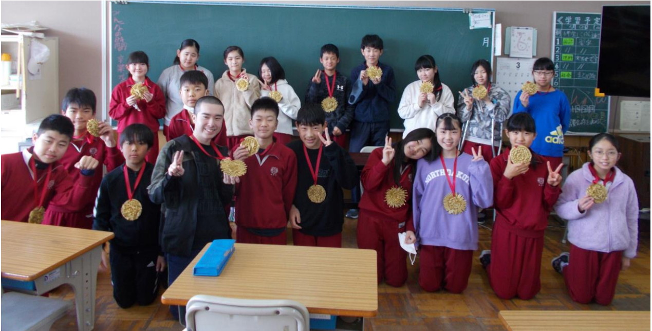
(1年生からの「金メダル」のプレゼントを首からさげて、嬉しそうな6年生)

保護者・地域の皆様には、日頃より温かく子どもたちを見守っていただき、ありがとうございました。これからも、子どもたちのことを支えていただければありがたく存じます。