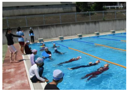
6年：着衣泳を体験し、命を守る学習をしました。