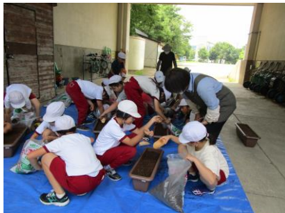
4年：市の方に教えていただき、花の種をまきました。