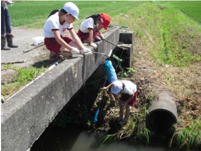
1年：近くの川にザリガニ釣りに出かけました

73日間の1学期が終わりました。コロナ禍ですが、104名の秋津っ子は、1学期、学習や活動に一生懸命に取り組みながら、元気に学校生活を送ってきました。