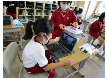
3年：タブレットを使い、モンシロチョウを観察しました。