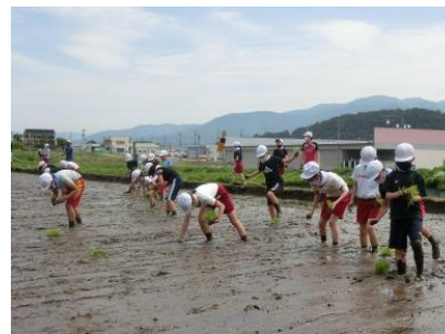
5年：全校の中心となって、田植えを進めました。