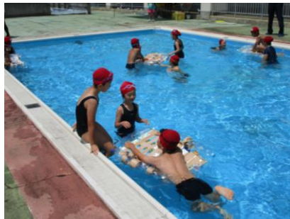
2年：自分たちで作った船をプールに浮かべました。