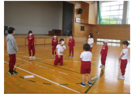
6年：児童会のリーダーとして 写真は、仲よしグループでのレクリエーションの様子です。