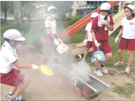
5年：飯盒炊爨の練習 いろいろな準備をして、無事にキャンプを実施できました。