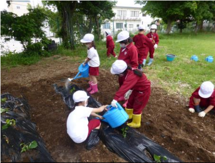
1年：さつまいもの世話 校庭の畑への毎日の水やり、頑張りました。秋の収穫が楽しみです。

4月6日の入学式から始まった73日間の1学期ですが、早いもので7月22日に終業式を迎えました。コロナ禍で制約の多い中ですが、それぞれの学年ごとに学習や活動を進め、元気に過ごしてきました。