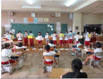
2年：1年生に本の紹介 国語の学習で、お気に入りの本を工夫して紹介しました