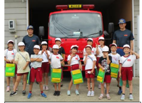
3年：秋津消防団の見学 見学を通して、地域を守る活動について学びました。