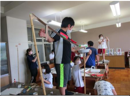
4年：図工で大型の作品制作 図工室の空間をいっぱいに使った作品づくりに取り組みました。