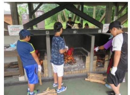
飯ごう炊さんでカレー

これまで佐渡学習で毎年心配してきた台風などによる船便の不安や、緊急時の家庭との連携の取りにくさ、児童の日程的な余裕や保護者の経費負担などを再検討し、目的地を佐渡から上越市能生と鵜の浜周辺に切り替えて、初めての実施となりました。今年は船にこそ乗らなかったものの、上越市立水族博物館や能生漁港での「せり」を見学し、海に入ってサザエ拾いをして壺焼きにして食べ、アジの干物づくりや飯ごう炊さんをするなど余裕のある日程の中で様々な体験をすることができました。雨や風のため、計画していたキャンプファイヤーや朝の地引き網体験ができなかったのが残念でしたが、夜の鵜の浜海岸で花火をしたり、朝の海岸で散策をして貝殻を拾ったりすることができました。