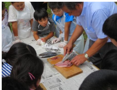
アジを開いて干物作り体験