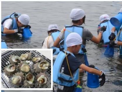
サザエを拾って壺焼きに