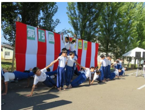
① 4年生「みゆき祭」で組体操を披露