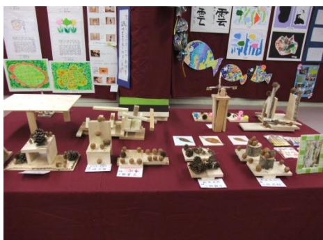
③ やなぎ・ひまわりの子の作品展示