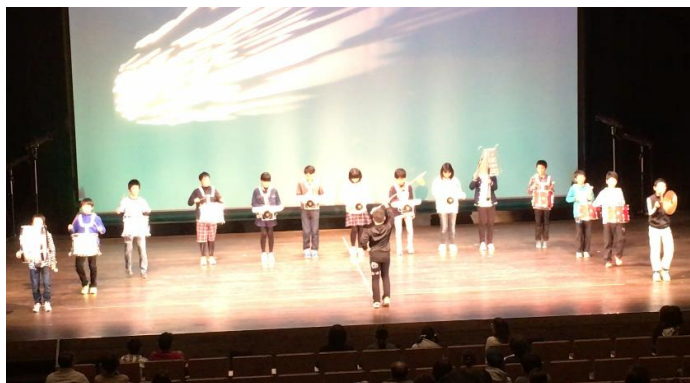
② 6年生「市青少年芸術祭」で鼓笛を披露