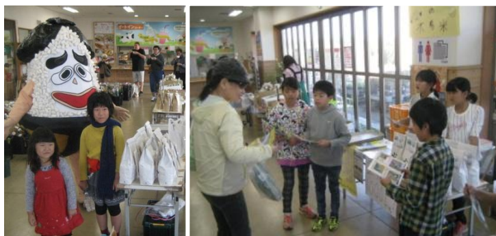
④ 5年生代表 JA横須賀「すかなごっそ」で米の試食販売