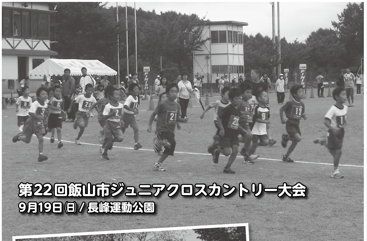
第22回飯山市ジュニアクロスカントリー大会 9月19日(日) / 長峰運動公園

発行：特定非営利活動法人 飯山市体育協会 / 〒389-2251 飯山市大字旭 4722 飯山市民体育館内 印刷：(有)足立印刷所